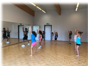
Se déhancher sur des rythmes endiablés