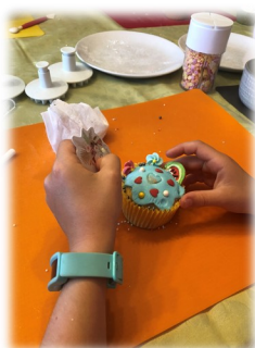
Créer des cupcakes