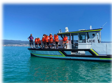
Embarquer sur le bateau de la police du lac