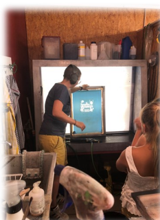
Découvrir l'univers de la sérigraphie