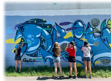
S'intéresser à l'art sous toutes ses formes