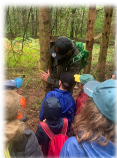
Partir sur les traces des animaux