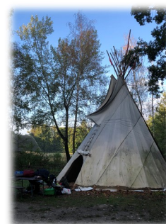
Passer la nuit dans les tipis