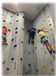
Se dépasser et toujours aller plus haut