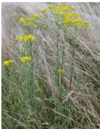
Séneçon jacobée / Jakobskreuzkraut ( Senecion jacobaea )

Afin d'éviter la dissémination des graines à partir des plantes arrachées, notamment si elles étaient proches de la maturité, ces plantes devraient être éliminées rapidement et de façon appropriée, c'est-à-dire dans une installation d'incinération ou de méthanisation (biogaz). Attention, elles peuvent atteindre la maturité et former des graines si elles sont entreposées sur un compost ou dans une déchetterie sans être broyées ou recouvertes rapidement.